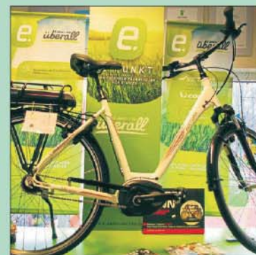
E-Bikes sind nach wie vor der Renner: Hier ein Modell für jeden Zweck.

Ob E-Bike oder das klassische Fahrrad, wer sich gerne auf einem Zweirad fortbewegt ist am Samstag, 8. April, herzlich eingeladen, dieses einmal ganz unverbindlich auszuprobieren. In der Zeit von 9 bis 16 Uhr stellt Fahrrad-Knobloch in Albersdorf am Bürgermeister-Golz-Platz (Marktplatz) seine Fahrräder und E-Bikes der neuesten Generation in verschiedenen Ausführungen zum Probefahren zur Verfügung. Ein Highlight ist zum Beispiel das neue E-Bike von Victoria im Retro-Look. Es besticht nicht nur durch sein ausgefallenes Design, sondern hat auch alle technischen Voraussetzungen, um je nach Fahrweise bis zu 170 Kilometer entspanntes Fahrradfahren zu genießen. Mit dazu bei tragen unter anderem ein 36-Volt-Mittelmo-