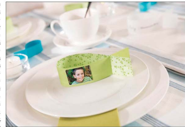
Fotosticker mit Aufnahmen der Hauptperson geben der Tischdekoration zur Konfirmation oder Kommunion eine persönliche Note.

(djd). Im Frühling steht für viele Kinder und Jugendliche ein ganz besonderes Ereignis an: die Konfirmation oder Kommunion. Der Eintritt in die Kirchengemeinschaft ist ein wichtiger Meilenstein auf dem Weg ins Erwachsenenleben, der mit Familie und Freunden gebührend gefeiert wird. Dieses besondere Ereignis wird gut geplant und mit viel Liebe zum Detail organisiert. Gerade auf die festliche und zugleich frühlingshafte Tischdekoration kommt es dabei an. Unter www.cewe.de in der Themenwelt "Kommunion & Konfirmation" beispielsweise gibt es Inspirationen für stimmungsvolle Accessoires. Hier sind drei Ideen, die wenig Arbeit, aber jede Menge Eindruck machen.