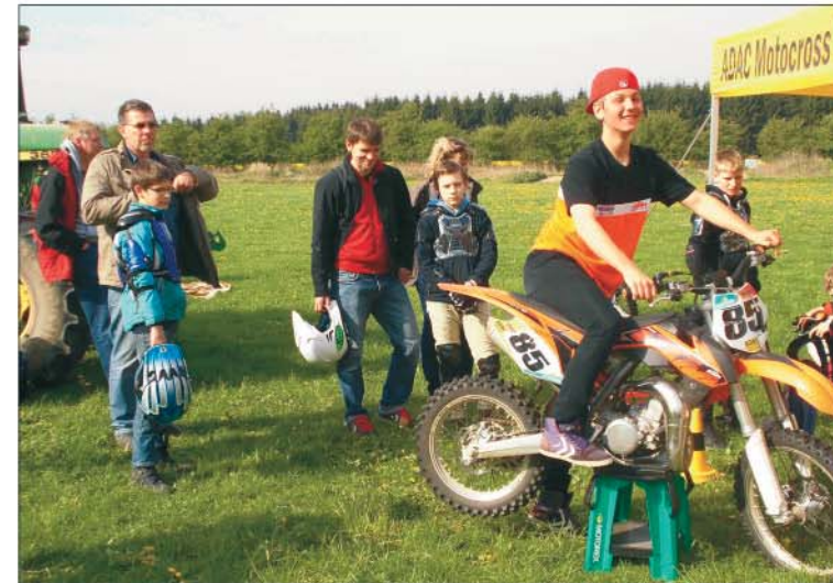
Locker und mit viel Spaß an der Sache vermitteln die Instrukto- ren alles, was die jungen Schüler über das Motorrad wissen müssen

Grüntal – Nach dem großen Erfolg im Vorjahr ist die Motocrossschule des ADAC Schleswig-Holstein 2017 wieder auf dem Grünthalring zu Gast. Wegen des großen Andrangs konnten leider nicht alle Interessierten an der Schulung im vergangenen Jahr teilnehmen. Viele Mädchen und Jungen träumen bestimmt davon, einmal ein echtes Motorrad zu fahren, einen Gang einzulegen und dann einfach nur noch Gas zu geben, um loszufahren. Dieses Erlebnis bietet ihnen der Motorclub Albersdorf (ADAC) am Samstag, dem 8. und Sonntag, dem 9. April ab 9:00 Uhr. Eingeladen sind Mädchen und Jungen