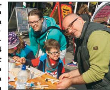
Das umfangreiche Rahmenprogramm der Kindermeile sorgte für viel Spaß und Abenteuer. mc

junge Generation reichlich spannende Auswahl, und viele der Teilnehmer hatten sich extra etwas einfallen lassen. Sei es ein Kinder-