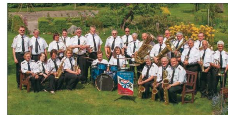
Der nächste Auftritt des Musikzuges Hademarschen ist am 21. April im Sport- und Jugendheim Hohenwestedt, zusammen mit den Musikzügen Aukrug und Hohenwestedt.

erwehrt. Musikzug Hanerau-Hademarschen nach allen Regeln der tonalen Kunst „servierte“. Wem dieser Genuss entgangen ist, der sollte sich in jedem Fall Freitag, den 21. April im Kalender vormerken. Ab 19.30 Uhr startet an diesem Abend das Musikfest