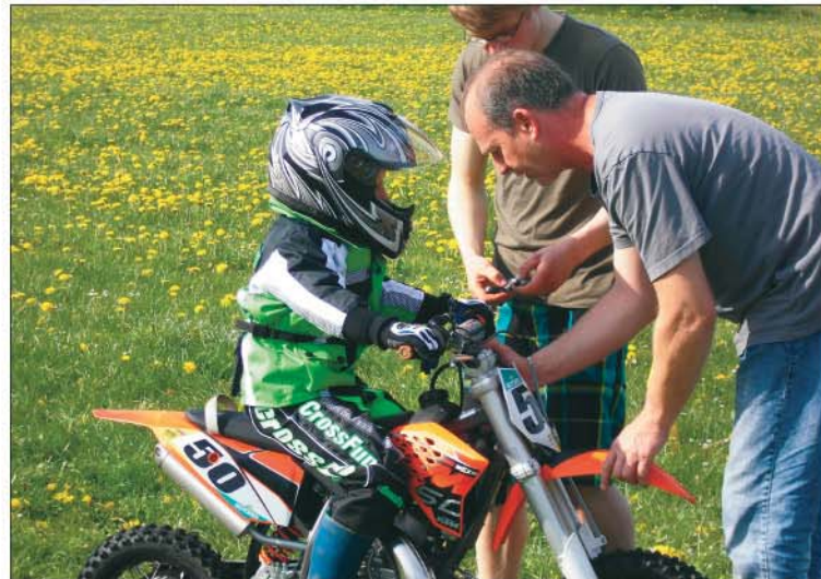
Die erste Alleinfahrt steht an.