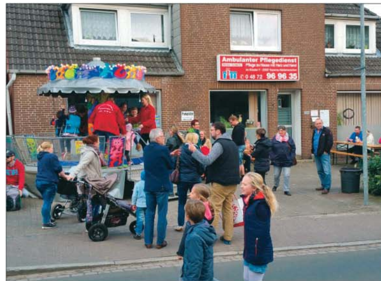
Während die Kinder auf dem Karussell ihre Runden drehten, informierten sich die „Großen“ über das Leistungsspektrum des Pflegedienstes.

die „Großen“ in Ruhe unterhalten und über das Leistungsspektrum des ambulanten Pflegedienstes informieren, während der Nachwuchs genüsslich seine Runden dreht. Mit seinem ansässigen Team bietet der Pflegedienst seit dem Jahr 2001 eine qualifizierte, ganzheitliche Versorgung vom Standort Im Kloster 7 aus für Hanerau-Hademarschen und die Umgebung an. Seit dem Jahr 2008 gehört dazu auch die Palliativpflege. Darüber hinaus wird auch