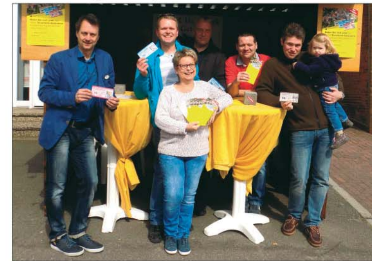
Vorstellung des „Homarscher Talers“ auf dem Frühlingsfest. Ab sofort ist der Geschenkgutschein gültig und bei der Raiffeisenbank Hademarschen sowie bei Stotz am Markt erhältlich.

Taler/Euro) gibt es einen dekorativen Schutzumschlag mit Motiven des Ortes, der Jahreszeit oder eines besonderen Anlasses (zum Beispiel Weihnachten, Ostern, Konfirmationen).