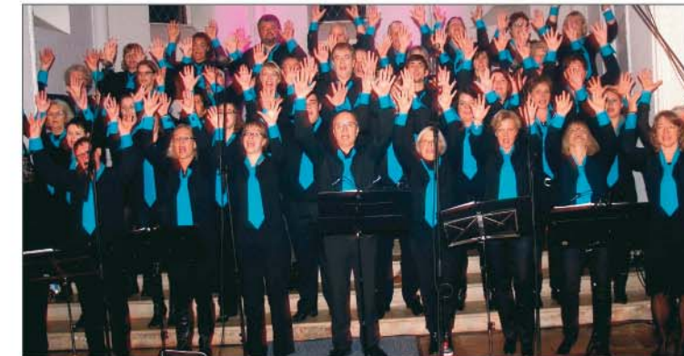
Das nächste Konzert findet am 13. April, 19.30 Uhr im Gäste- und Veranstaltungszentrum Büsum statt.

Frühlingsfest, Sonnenschein, zahlreiche Attraktionen und gutgelaunte Besucher, an solch einem Tag lag natürlich auch reichlich Musik in der Luft. So hieß es zwischen 14 und 15 Uhr auf der Festbühne (bei Pfeiffer) Bühne frei für