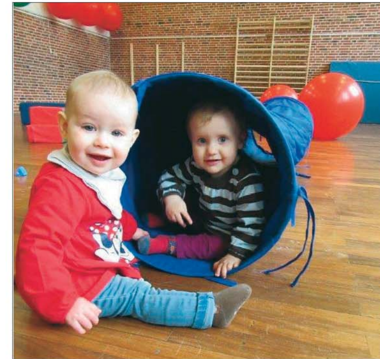
Die Krabbelgruppe trifft sich immer donnerstags von 8.30 Uhr bis 10 Uhr in der Turnhalle am kommunalen Kindergarten.

Regelmäßige Treffen: - Krabbelgruppe donnerstags 8:30 – 10:00 Uhr in der Turnhalle am kommunaler Kindergarten - „Coffee to go“, jeden Freitag ab 8:00 Uhr - Sprachkurs für Frauen, Montags & Mittwochs 8:30 – 10:00 Uhr (zur Zeit ausgebucht)