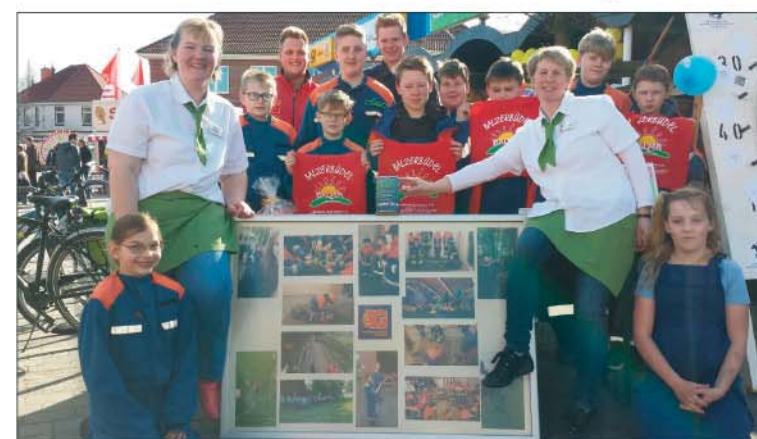
Die Jugendfeuerwehr bedankt sich herzlich bei Bäcker Balzer.

Einnahmen durften sie am Ende des Tages nicht nur behalten, Bäcker Balzer rundete den Betrag sogar noch großzügig auf 350 Euro auf. Die Jugendfeuerwehr in Gokels kann sich über durchaus reges Interesse freuen. Zu den Aktivitäten zählen nicht allein Übungen die auf die Feuerwehrarbeit vorbereiten und mit den Gerätschaften vertraut machen, sowie diverse Schulungen oder Erste Hilfe Kurse. Für einen guten Zusam-