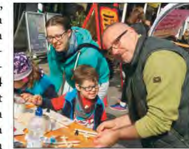
Das umfangreiche Rahmenprogramm der Kindermeile sorgte für viel Spaß und Abenteuer. mc

junge Generation reichlich spannende Auswahl, und viele der Teilnehmer hatten sich extra etwas einfallen lassen. Sei es ein Kinder-