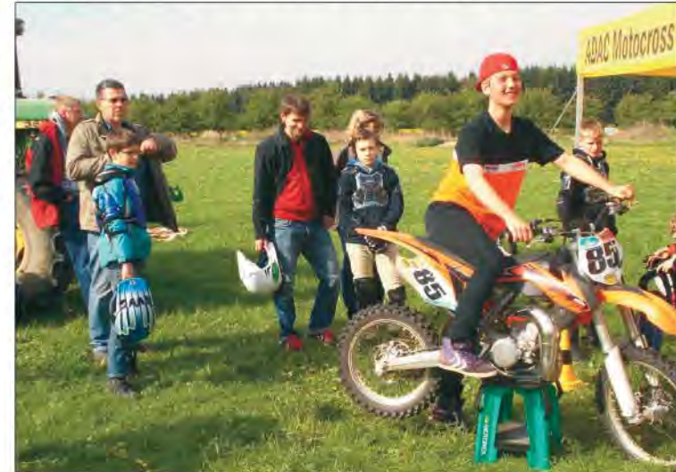
Locker und mit viel Spaß an der Sache vermitteln die Instrukto- ren alles, was die jungen Schüler über das Motorrad wissen müssen

Grünthal – Nach dem großen Erfolg im Vorjahr ist die Motocrossschule des ADAC Schleswig-Holstein 2017 wieder auf dem Grünthalring zu Gast. Wegen des großen Andrangs konnten leider nicht alle Interessierten an der Schulung im vergangenen Jahr teilnehmen. Viele Mädchen und Jungen träumen bestimmt davon, einmal ein echtes Motorrad zu fahren, einen Gang einzulegen und dann einfach nur noch Gas zu geben, um loszufahren. Dieses Erlebnis bietet ihnen der Motorclub Albersdorf (ADAC) am Samstag, dem 8. und Sonntag, dem 9. April ab 9:00 Uhr. Eingeladen sind Mädchen und Jungen