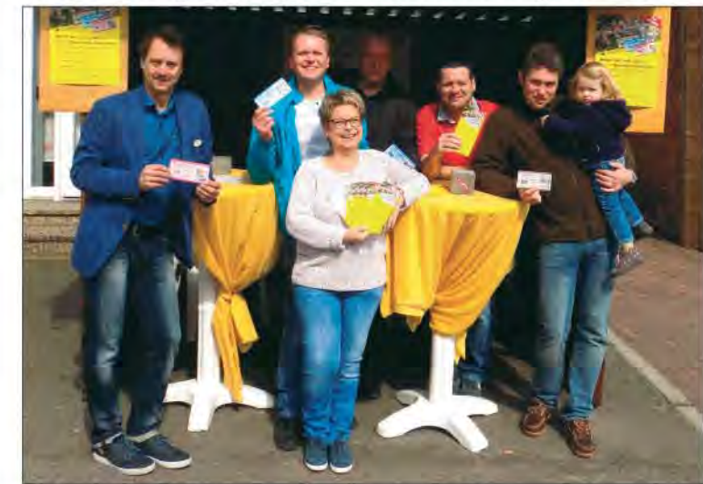
Vorstellung des „Homarscher Talers“ auf dem Frühlingsfest. Ab sofort ist der Geschenkgutschein gültig und bei der Raiffeisenbank Hademarschen sowie bei Stotz am Markt erhältlich.

Taler/Euro) gibt es einen dekorativen Schutzumschlag mit Motiven des Ortes, der Jahreszeit oder eines besonderen Anlasses (zum Beispiel Weihnachten, Ostern, Konfirmationen).