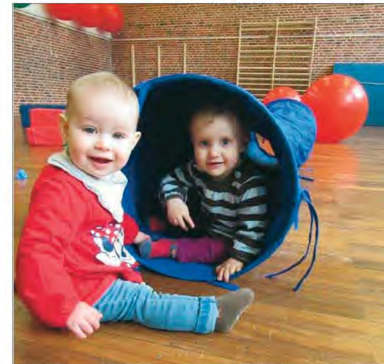
Die Krabbelgruppe trifft sich immer donnerstags von 8.30 Uhr bis 10 Uhr in der Turnhalle am kommunalen Kindergarten.

Regelmäßige Treffen: - Krabbelgruppe donnerstags 8:30 – 10:00 Uhr in der Turnhalle am kommunalen Kindergarten - „Coffee to go“, jeden Freitag ab 8:00 Uhr - Sprachkurs für Frauen, Montags & Mittwochs 8:30 – 10:00 Uhr (zur Zeit ausgebucht)