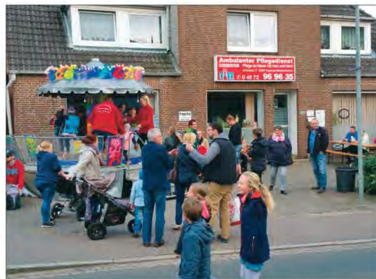
Während die Kinder auf dem Karussell ihre Runden drehten, informierten sich die „Großen“ über das Leistungsspektrum des Pflegedienstes.

die „Großen“ in Ruhe unterhalten und über das Leistungsspektrum des ambulanten Pflegedienstes informieren, während der Nachwuchs genüsslich seine Runden dreht. Mit seinem ansässigen Team bietet der Pflegedienst seit dem Jahr 2001 eine qualifizierte, ganzheitliche Versorgung vom Standort Im Kloster 7 aus für Hanerau-Hademarschen und die Umgebung an. Seit dem Jahr 2008 gehört dazu auch die Palliativpflege. Darüber hinaus wird auch