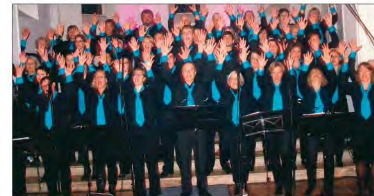
Das nächste Konzert findet am 13. April, 19.30 Uhr im Gäste- und Veranstaltungszentrum Büsum statt.

Frühlingsfest, Sonnenschein, zahlreiche Attraktionen und gutgelaunte Besucher, an solch einem Tag lag natürlich auch reichlich Musik in der Luft. So hieß es zwischen 14 und 15 Uhr auf der Festbühne (bei Pfeiffer) Bühne frei für