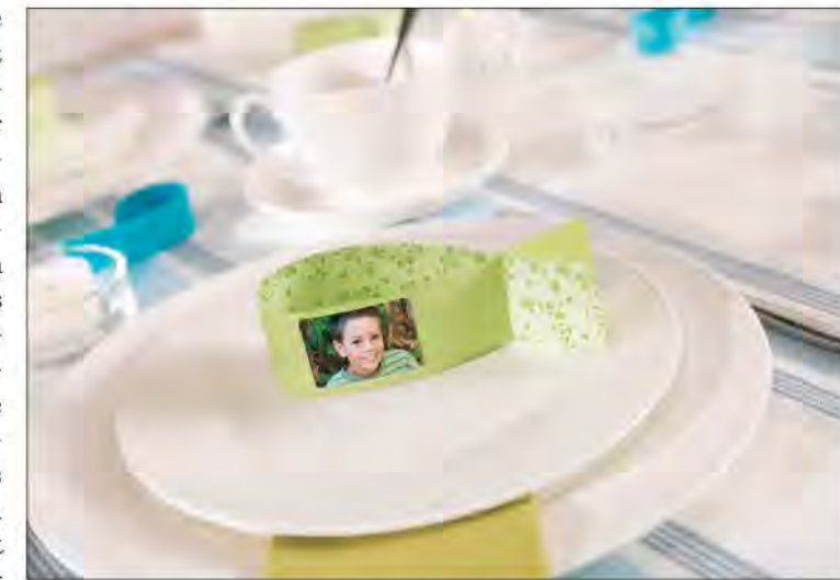
Fotosticker mit Aufnahmen der Hauptperson geben der Tischdekoration zur Konfirmation oder Kommunion eine persönliche Note.

(djd). Im Frühling steht für viele Kinder und Jugendliche ein ganz besonderes Ereignis an: die Konfirmation oder Kommunion. Der Eintritt in die Kirchengemeinschaft ist ein wichtiger Meilenstein auf dem Weg ins Erwachsenenleben, der mit Familie und Freunden gebührend gefeiert wird. Dieses besondere Ereignis wird gut geplant und mit viel Liebe zum Detail organisiert. Gerade auf die festliche und zugleich frühlingshafte Tischdekoration kommt es dabei an. Unter www.cewe.de in der Themenwelt "Kommunion & Konfirmation" beispielsweise gibt es Inspirationen für stimmungsvolle Accessoires. Hier sind drei Ideen, die wenig Arbeit, aber jede Menge Eindruck machen.