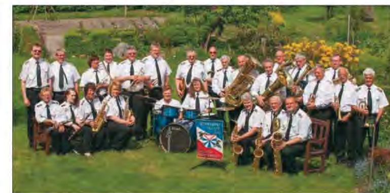
Der nächste Auftritt des Musikzuges Hademarschen ist am 21. April im Sport- und Jugendheim Hohenwestedt, zusammen mit den Musikzügen Aukrug und Hohenwestedt.

erwehrt-Musikzug Hanerau-Hademarschen nach allen Regeln der tonalen Kunst „servierte“. Wem dieser Genuss entgangen ist, der sollte sich in jedem Fall Freitag, den 21. April im Kalender vormerken. Ab 19.30 Uhr startet an diesem Abend das Musikfest