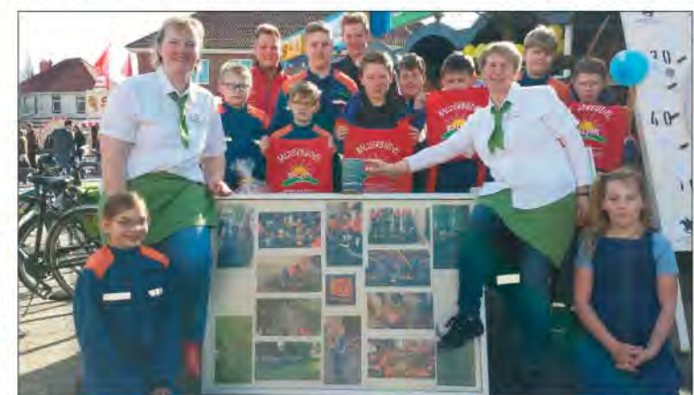
Die Jugendfeuerwehr bedankt sich herzlich bei Bäcker Balzer.

Einnahmen durften sie am Ende des Tages nicht nur behalten, Bäcker Balzer rundete den Betrag sogar noch großzügig auf 350 Euro auf. Die Jugendfeuerwehr in Gokels kann sich über durchaus reges Interesse freuen. Zu den Aktivitäten zählen nicht allein Übungen die auf die Feuerwehrarbeit vorbereiten und mit den Gerätschaften vertraut machen, sowie diverse Schulungen oder Erste Hilfe Kurse. Für einen guten Zusam-