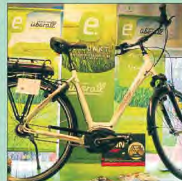
E-Bikes sind nach wie vor der Renner: Hier ein Modell für jeden Zweck.

Ob E-Bike oder das klassische Fahrrad, wer sich gerne auf einem Zweirad fortbewegt ist am Samstag, 8. April, herzlich eingeladen, dieses einmal ganz unverbindlich auszuprobieren. In der Zeit von 9 bis 16 Uhr stellt Fahrrad-Knobloch in Albersdorf am Bürgermeister-Golz-Platz (Marktplatz) seine Fahrräder und E-Bikes der neuesten Generation in verschiedenen Ausführungen zum Probefahren zur Verfügung. Ein Highlight ist zum Beispiel das neue E-Bike von Victoria im Retro-Look. Es besticht nicht nur durch sein ausgefallenes Design, sondern hat auch alle technischen Voraussetzungen, um je nach Fahrweise bis zu 170 Kilometer entspanntes Fahrradfahren zu genießen. Mit dazu bei tragen unter anderem ein 36-Volt-Mittelmo-