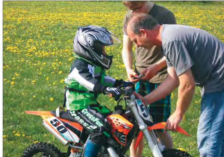
Die erste Alleinfahrt steht an.